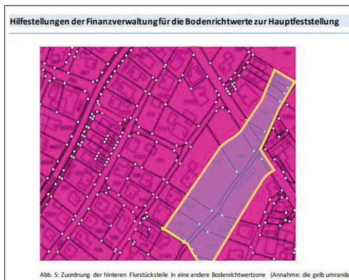
Abb. 5: Zuordnung der hinteren Flurstücksteile in eine andere Bodenrichtwertzone (Annahme: die gelb umrandet)

Da die Bodenrichtwerte der einzige wertbestimmende Faktor für die Grundsteuer sind, kommt ihnen eine besondere Bedeutung zu. Die Finanzverwaltung hat für die Bestimmung der Bodenrichtwerte daher Hilfestellungen an die Gutachterausschüsse herausgegeben. Zur Bestimmung der Bodenrichtwerte werden sogenannte Bodenrichtwertzonen gebildet. Die Bodenrichtwertzonen sollen so abgegrenzt werden, dass lagebedingte Wertunterschiede zwischen den Grundstücken, für die der Bodenrichtwert gelten soll und dem Bodenrichtwertgrundstück (Referenzgrundstück zur Bestimmung des Bodenrichtwerts) nicht mehr als 30 Prozent betragen. Da auf Wertunterschiede der Grundstücke innerhalb derselben Bodenrichtwertzone (z. B. durch die Bebaubarkeit) keine Rücksicht genommen wird, sollten die Grundstücke innerhalb einer Bodenrichtwertzone möglichst gleichwertig sein. Unterscheiden sich Grundstücke stark voneinander, kann es erforderlich sein, eine (zusätzliche) Bodenrichtwertzone zu bilden.