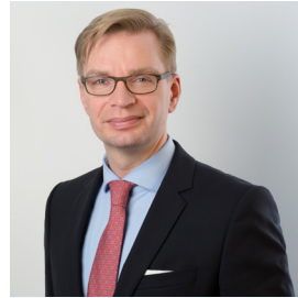
Reiner Holznagel Vorsitzender des Instituts

Der vorgezogene Bundestagswahlkampf 2025 steht bevor und wir sind bereit, unsere Stimme für eine gerechte Steuerpolitik zu erheben. Unser Institut hat umfassende Reformvorschläge für den Einkommensteuertarif erarbeitet und einen konkreten 10-Punkte-Plan zur Modernisierung der Unternehmensbesteuerung entwickelt.