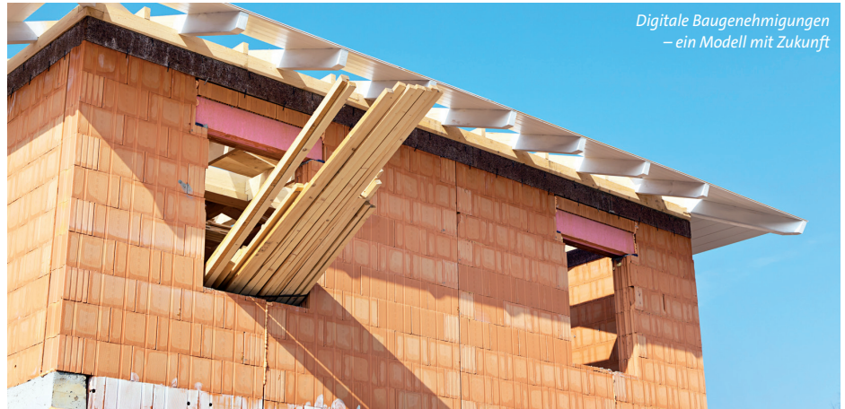
Digitale Baugenehmigungen – ein Modell mit Zukunft

Auch Sie können uns jederzeit Ihre Hinweise auf Steuergeldverschwendung schicken oder ihre Fragen zu Gebühren und Entgelten der öffentlichen Hand stellen. Schreiben Sie uns an info@steuerzahler-mv.de